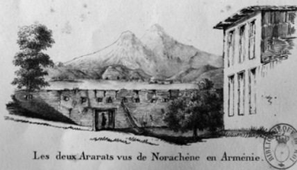
Les deux Ararats vus de Norachène en Arménie.